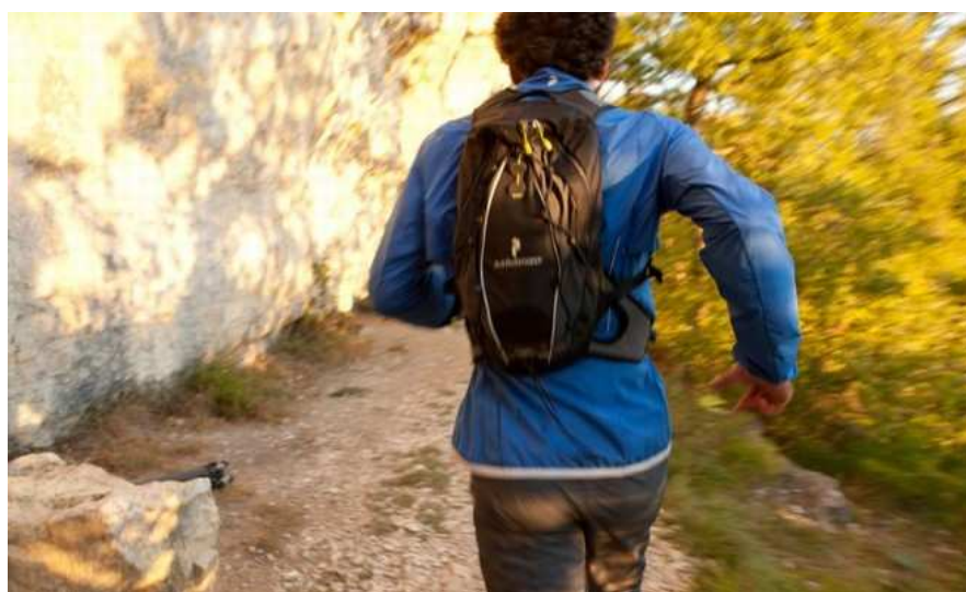
Pražská Letná se 22. května odpoledne stane dějištěm charitativní akce Běh s batohem.

Pražská Letná se 22. května odpoledne stane dějištěm charitativní akce Běh s batohem. Celý její výtěžek použije nezisková organizace Spolu dětem na tréninky dospělosti pro mladé lidi, kteří odcházejí z dětských domovů do samostatného života. Na akci se bude nejen běhat, budou se také dražit běžecké zážitky se známými osobnostmi, chybět nebude ani přehlídka kuriózních batohů.