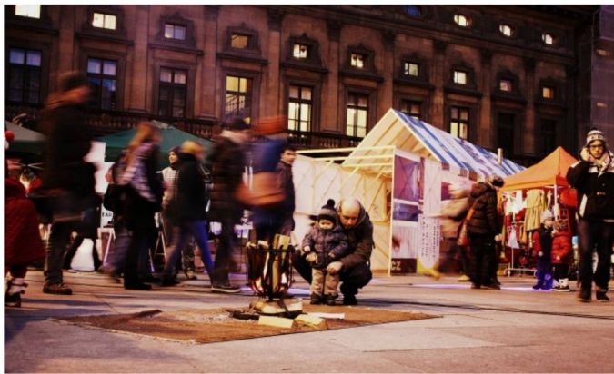
Vzít můžete i děti!

Novinkou také bude stánek Votočvohoz! Máte-li doma pěkné oblečení, které už nenajde uplatnění, přijďte k jejich stánku s možností ho vyměnit za něco jiného. Popřípadě si můžete sami vyrobit designovou tašku.