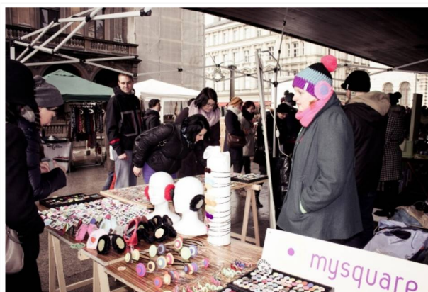
Spoustu inspirace a krásných výrobků – to je Dyzejn Márket!